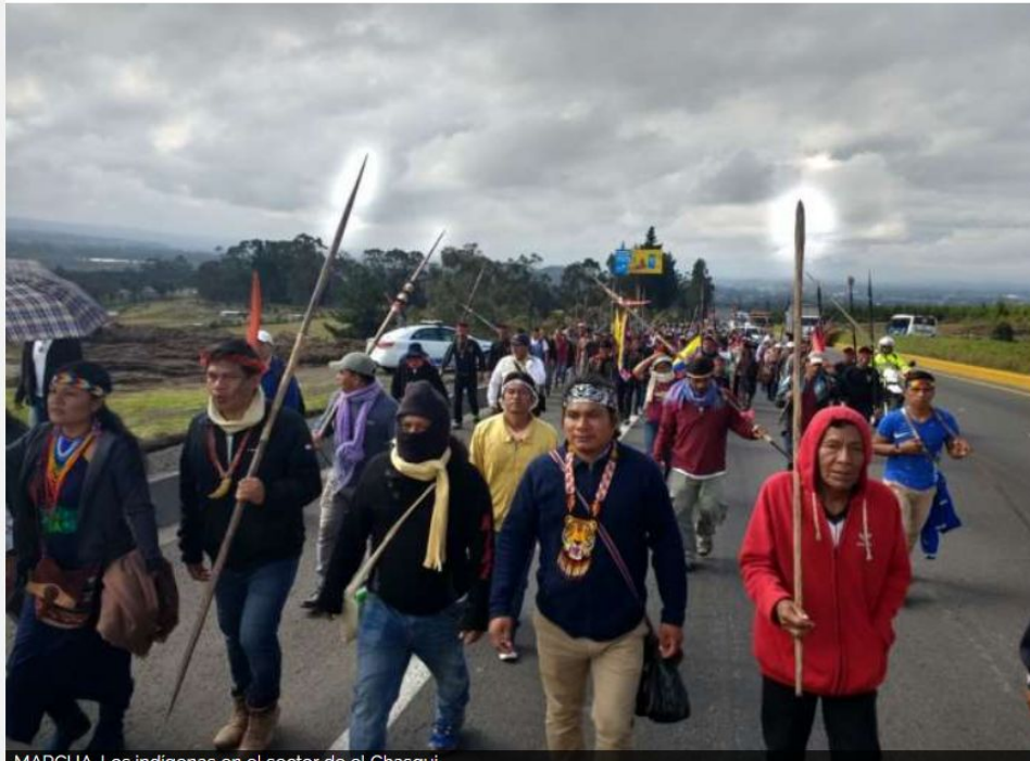
MARCHA. Los indígenas en el sector de el Chasqui